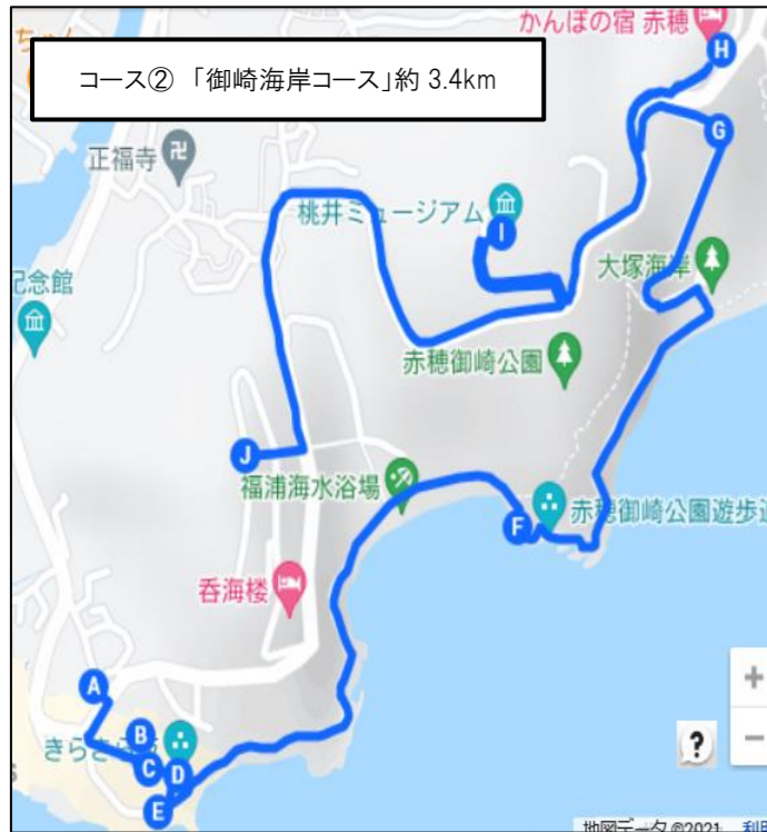
コース②「御崎海岸コース」約 3.4km

瀬戸内海国立公園内に位置し、美しく輝く瀬戸内海を楽しみながら海岸沿いを歩いていただく御崎ルートです。“よみがえりの湯”として有名な赤穂温泉街を通りますので、ぜひお立ち寄りください！