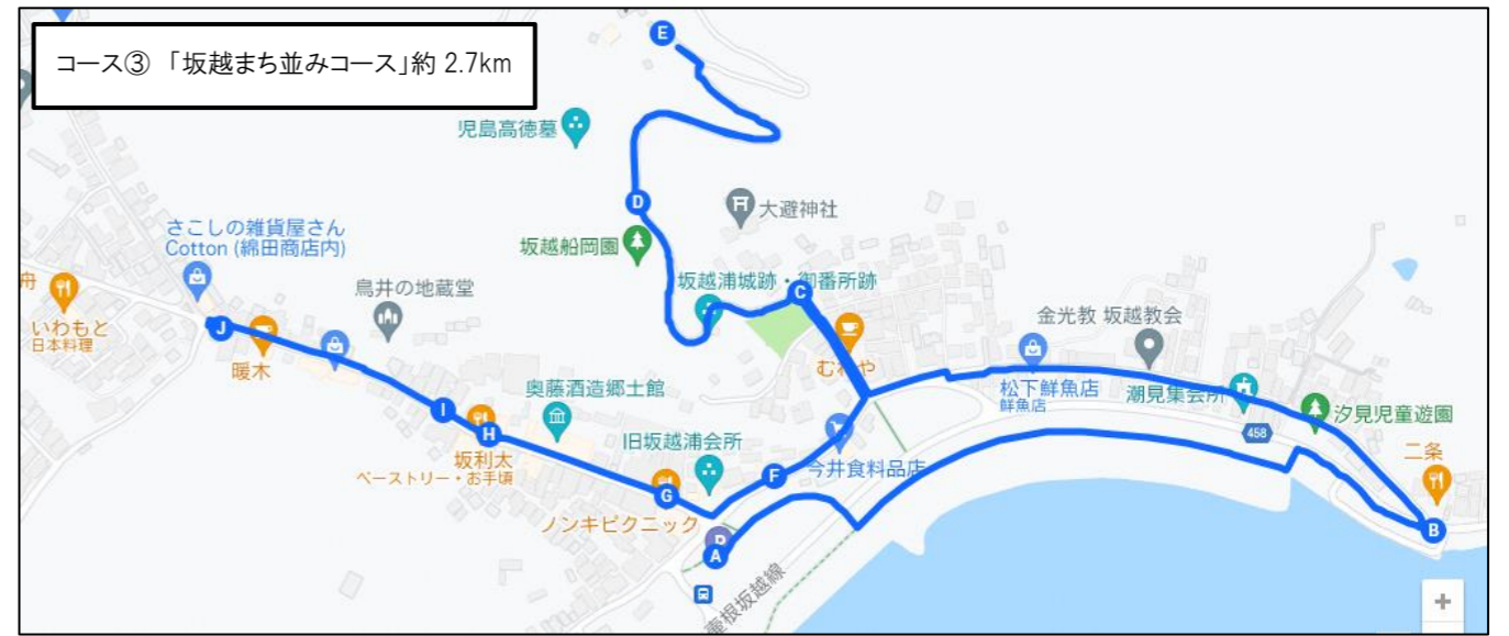
コース③「坂越まち並みコース」約 2.7km