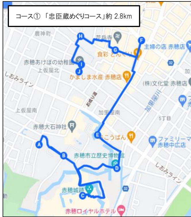
コース①「忠臣蔵めぐりコース」約 2.8km

浅野家の菩提寺で、義士墓所のある「花岳寺」や、大石内蔵助をはじめ四十七義士を祀る「赤穂大石神社」、国史跡「赤穂城跡」など、忠臣蔵ゆかりの寺社、史跡を巡るルートです。赤穂義士たちの息吹を感じながら歩きましょう！