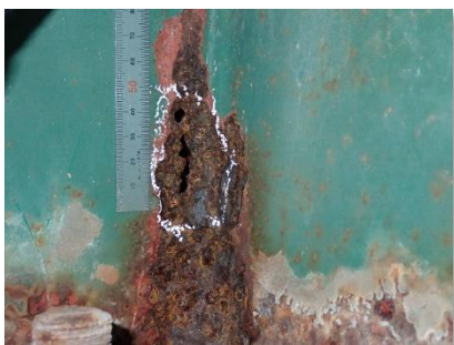
主桁に腐食が見られます