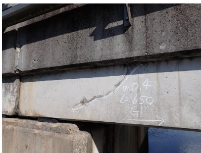
主桁にひびわれが見られます