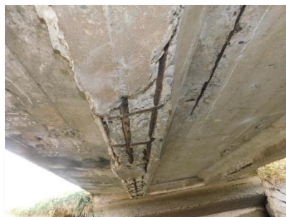
主桁に剥離・鉄筋露出が見られます