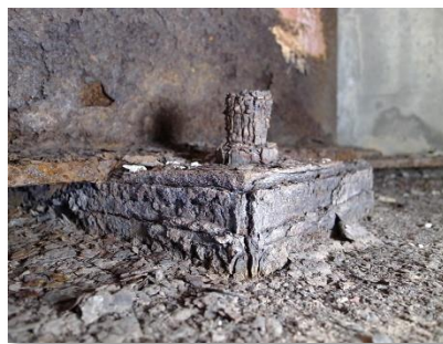
支承に腐食が見られます