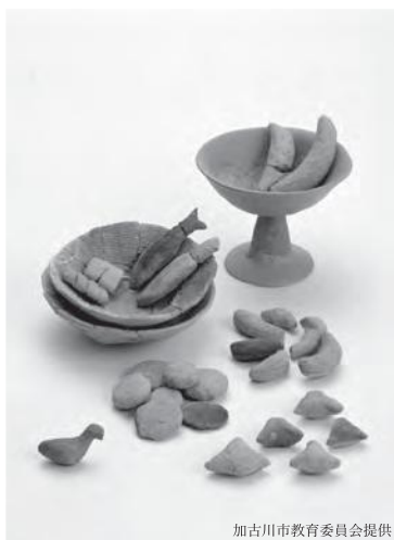
行者塚古墳出土土器・土製品（加古川市）