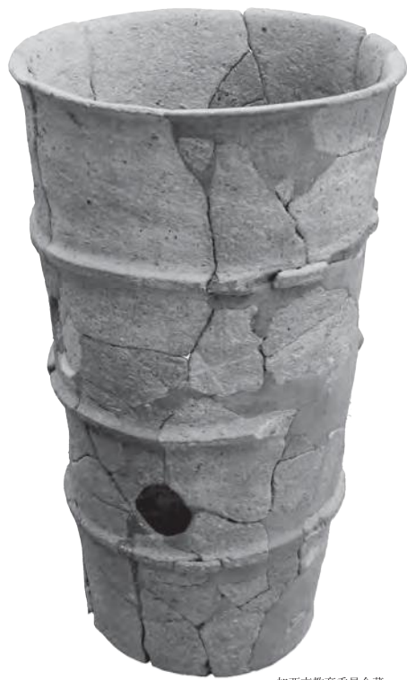
小山古墳（加西市）出土 円筒埴輪