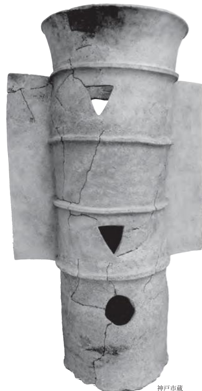
五色塚古墳（神戸市）出土 鱗付円筒埴輪

展示では最新の発見や調査成果を踏まえながら、播磨地域の特徴的な前方後円墳の変遷を紹介し、そこから変革の時代にあった播磨の古墳時代について解説します。