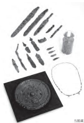
西野山3号墳出土遺物（上郡町）