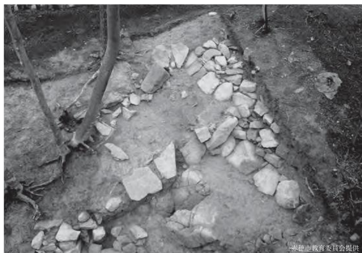
放亀山古墳・くびれ部（赤穂市）