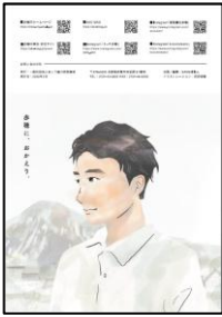
ガイドブック裏表紙

兵庫県が運営する移住窓口等にて配架するほか、大阪・東京の首都圏にて開催される移住相談会等において広く配布を行います。