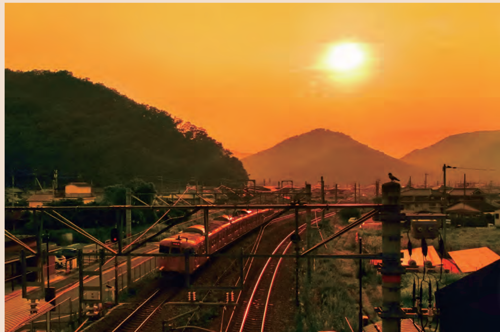
【準グランプリ】@kuro5131さん