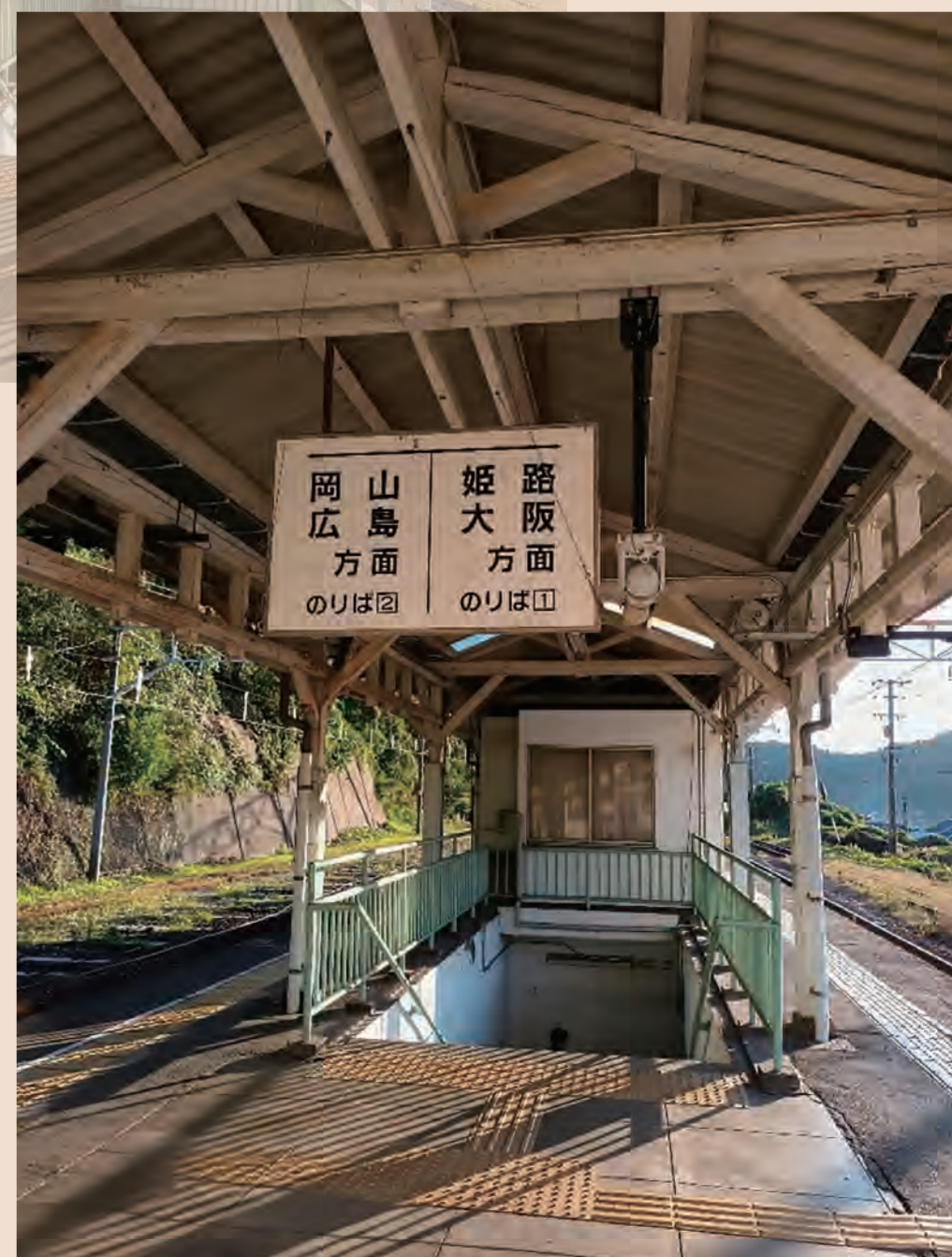
【準グランプリ】@fumiru922さん