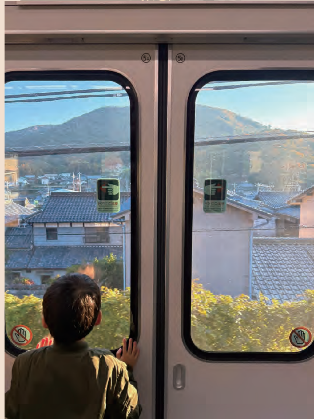
【準グランプリ】@du4nicht9siehstさん