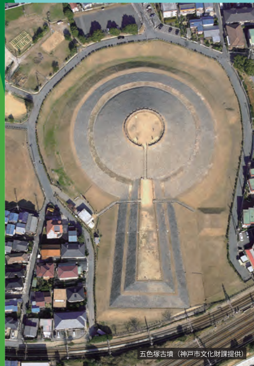
五色塚古墳