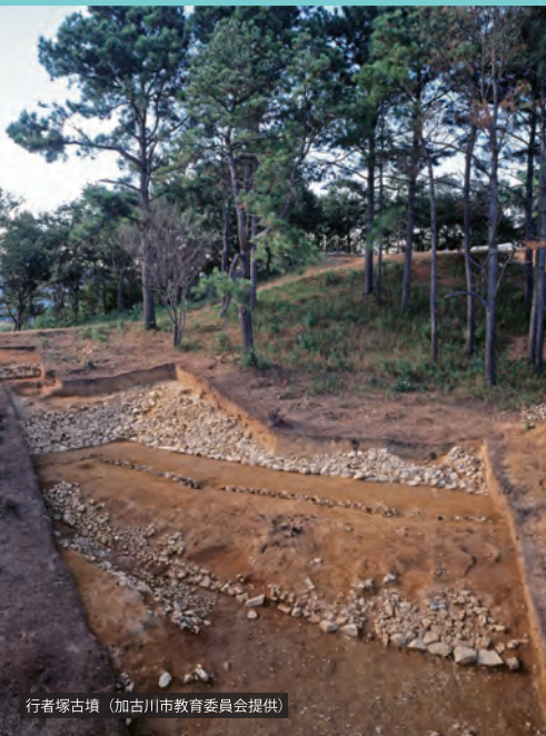
行者塚古墳