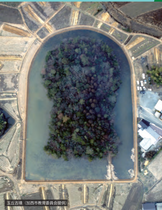
玉丘古墳