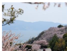
御崎から見る海は絶景！ 春は桜とのコラボレーションがステキ♡