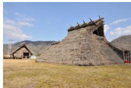
東有年・沖田遺跡公園