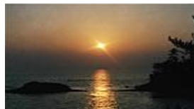
日本の夕陽百選に選ばれた御崎の夕陽