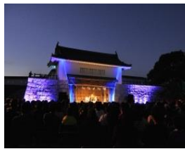
ル・ボン国際音楽祭 (赤穂城跡)