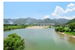
全国名水百選に選ばれた千種川