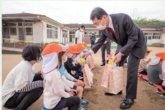
市長と社会福祉協議会理事長が、子どもの健やかな成長を願い、保育所を訪問し、子どもたちへプレゼントを手渡しました。(4/27 市内各保育所)