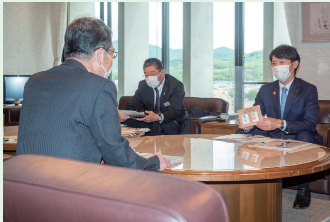
齋藤元彦兵庫県知事が市長を訪問し、医療、観光、交通などの分野について、意見交換を行いました。(5/14 市役所)