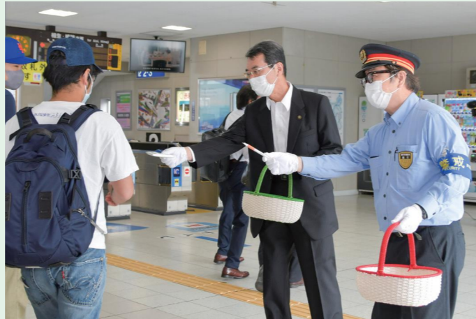
東備西播定住自立圏域 JR 利用促進協議会による JR 赤穂線および山陽本線の利用促進活動を、JR 播州赤穂駅ほか3箇所を実施しました。(5/27 JR 播州赤穂駅)