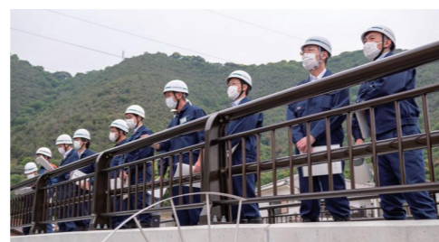
出水期を前に、水防本部構成員による巡察を行いました。(5/20 市内各所)