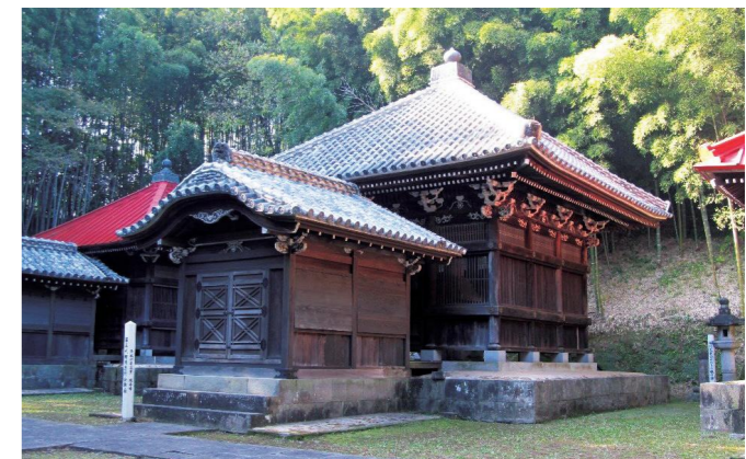
細川忠利霊廟(熊本市 北岡自然公園)