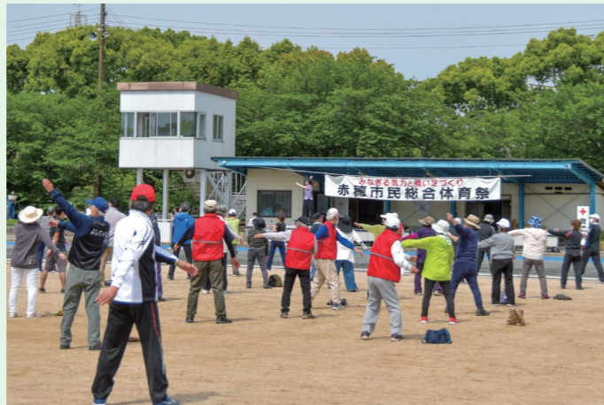
市民総合体育祭の「総合開会式」が開催されました。公開ラジオ体操も行われ、参加者は晴天の下、爽やかな汗を流しました。(5/15 城南緑地陸上競技場)