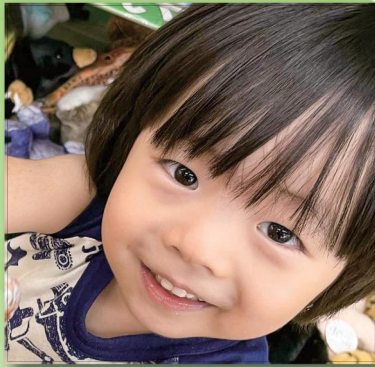
わが家のアイドル三男坊♪ 強く元気に育ってね！