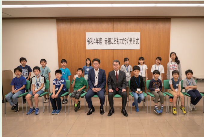
自然体験や社会体験を通して環境への関心と理解を深めることを目的に、小学生20名による「子どもエコクラブ」が発足しました。(5/22 市役所)