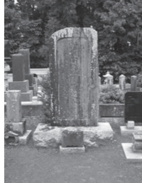
関鉄之介の墓(茨城県水戸市 常磐共有墓地)