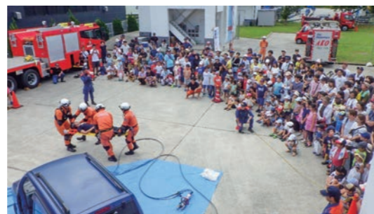
レスキュー隊による救助訓練展示