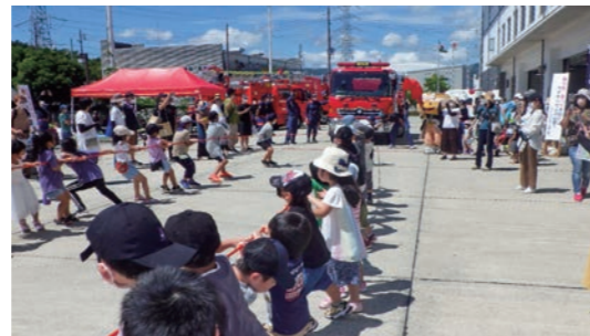
消防車と子どもたちの力くらべ！