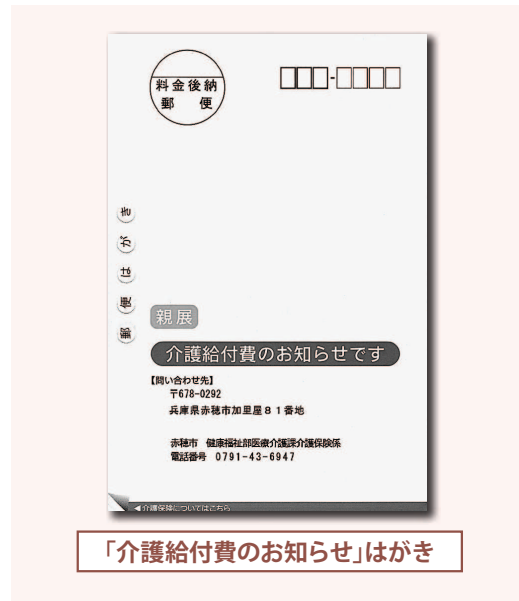
「介護給付費のお知らせ」はがき