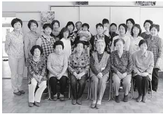
ふれあいサロン元塩グループさくらんぼ

平成17年4月に設立。毎月1回、手作り小物や夏休みお楽しみ教室、グラウンドゴルフ大会等、地域に住む多くの皆さんに楽しんでいただく内容を実施し、世代を超えたふれあいの場を目指して思いやりにあふれたサロンを実施されています。