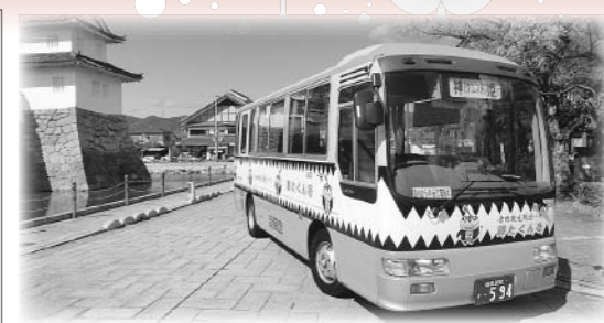
株式会社ウエスト神姫 赤穂営業所 赤穂市加里屋中洲3丁目53-1 ☎43・3325

【会社概要】 ●本社所在地 相生市電泉町394-1 ●事業内容 乗合・貸切旅客運送事業 自家用自動車管理業 旅行者代理業 ●営業所拠点 赤穂営業所、相生営業所、山崎営業所 ●車両保有台数 定期車84台 貸切バス13台 ●従業員 196名