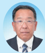
議長 西川 浩司