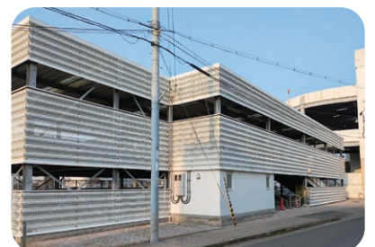
旧赤穂市立赤穂駅南自転車駐車場

現在利用されておらず、有効に活用されていない行政財産については、まずは公用または公共用として、適正かつ有効な活用について検討し、検討の結果、行政財産としての活用が見込めない場合は、普通財産として引き継ぎ、売却や貸付など有効活用を図っていく。また駐車場等の運用についても、利用状況を把握した上で、有料化や一括管理を含め、適正で有効な活用方法について検討していく。