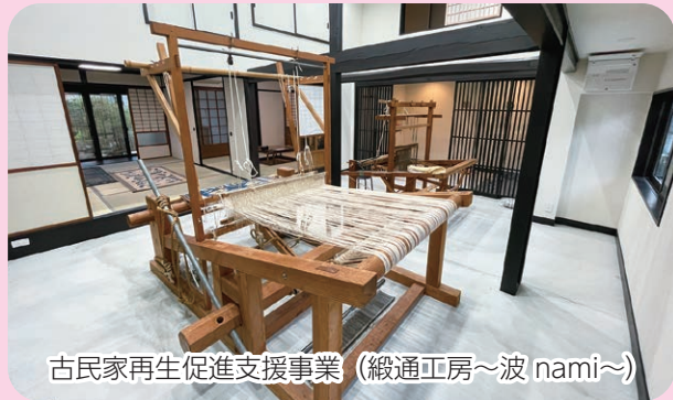
古民家再生促進支援事業 (緞通正房～波 nami～)