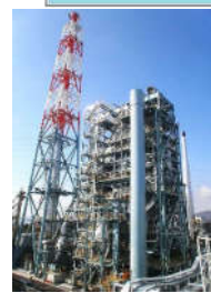
株式会社日本海水 赤穂バイオマス発電所