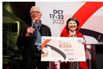
(オランダ「チネチッタ国際映画祭」)

ブリティッシュエアウェイズ、ルフトハンザ航空、スイス航空、オーストリア航空、オマーン航空、JAL(国内線、国際線)でも上映。