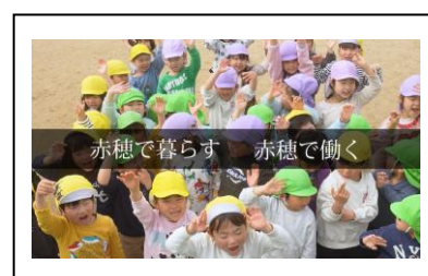
(職種：保育士・幼稚園教諭)