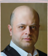
チェロ アレクサンダー・チャウシャン