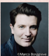
ピアノ アレッシオ・バックス