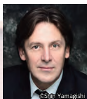
クラリネット ポール・メイエ