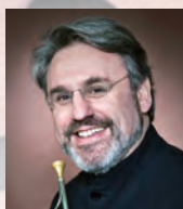
ホルン ラドヴァン・ヴラトコヴィチ