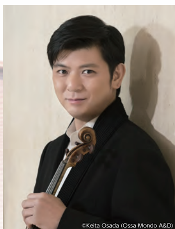
音楽監督 / ヴァイオリン 榎本 大進