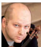
ヴァイオリン ボリス・プロフツィン