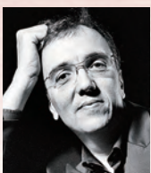
ピアノ エリック・ル・サーージュ