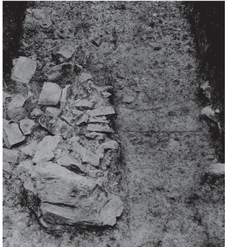
福浦黒嶼古墳調査写真

写真：赤穂城下町跡 発掘調査写真（上段左）、船戸山6号墳出土鉄釘（上段中央）、西有年・坂折池遺跡（上段右）、赤穂市給食センター寄贈資料（中段右）、塩屋阿弥陀堂貝塚 発掘調査写真（中段左）、船戸山8号墳出土須恵器（中段右）、福浦黒嶼古墳（兵庫県公開CS立体図データを加工、下段）