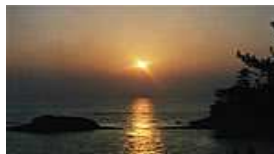
日本の夕陽百選に選ばれた御崎の夕陽