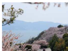
御崎から見る海は絶景！ 春は桜とのコラボレーションがステキ♡