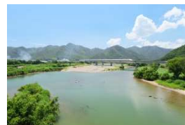
全国名水百選に選ばれた千種川