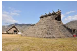
東有年・沖田遺跡公園