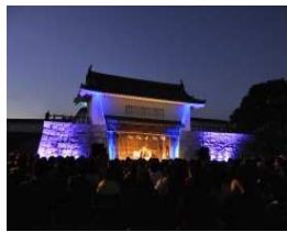
ル・ボン国際音楽祭 (赤穂城跡)