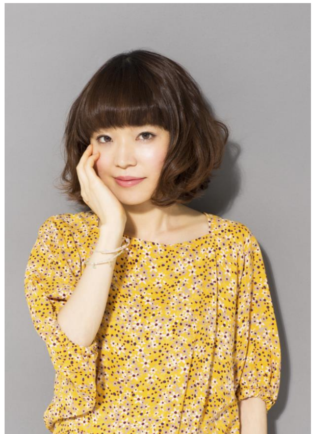
出演：川嶋 あい (シンガーソングライター)