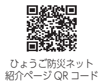
ひょうご防災ネット 紹介ページQRコード