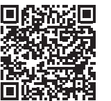
保留地売却 HP QRコード