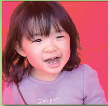
思いやりのある 優しい女の子になってね☆