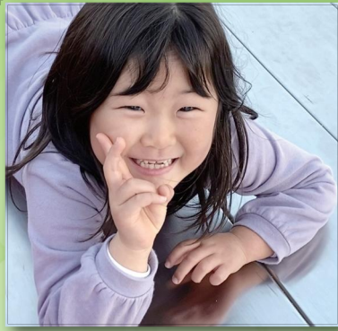
妹思いの優しいお姉ちゃん☆ いっぱいお手伝いしてくれてありがとう♪