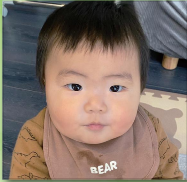
いつも癒しとありがとう いっぱい食べてすくすく元気に大きくなあれ！