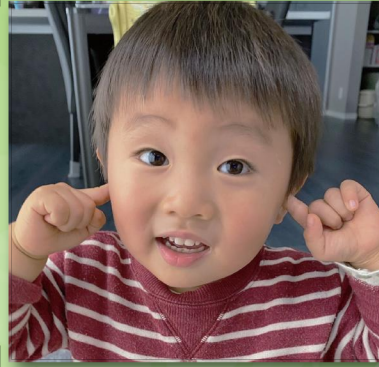
可愛いおちよけさん これからも弟想いの優しいお兄ちゃんであってね