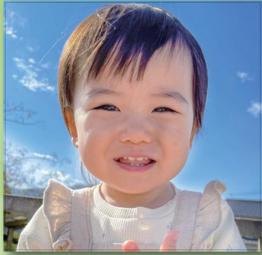
ちはるはお父さんとお母さんの 宝物！すくすく育ってね