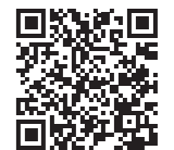
申告受付に関するHP

令和5年度の市県民税の申告受付について、詳しくは市民税係に問い合わせるか、市ホームページをご覧ください。