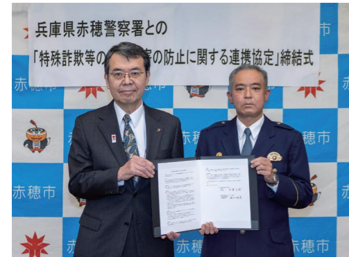
令和4年12月22日に協定締結式が開催されました。(赤穂市役所)