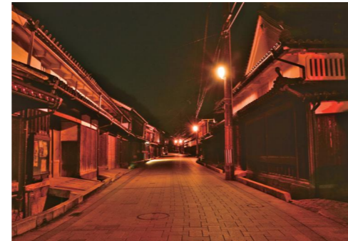
みんなでつくる日本遺産写真展

坂越の街並みは、海に向かうメインストリートである「大道」を中心に町割りが展開し、この大道に面して廻船業者の邸宅、寺院、浦会所など大型の建物が軒を連ねています。一方、かつての海岸に面した通りでは、高潮や波浪対策のために、主屋の正面に道路から1メートルほど高く石垣を積んだ上に板塀を巡らした町屋が連続しており、特徴ある街並みを見せています。こうした大道や海岸沿いの通りから、奥の山側や海辺に向かって随所に伸びる狭い路地では、港町らしい風情を感じることができます。