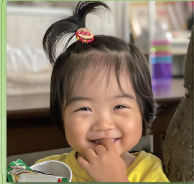
食いしん坊でアンパンマン大好き!! 元気にスクスク育ててね☆