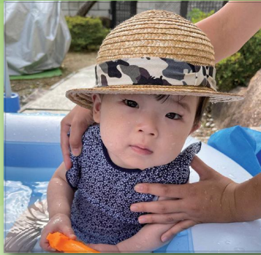
生まれてきてくれてありがとう。 元気いっぱい育ててね！