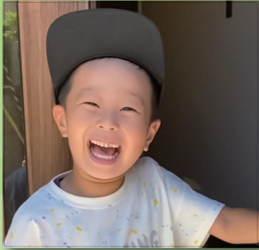
6歳のお誕生日おめでとう☆ 妹と仲良くね♪