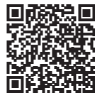
△気象庁 ホームページ