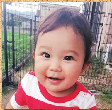
元気にすくすく大きくなってあ!