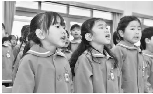
(尾崎幼稚園改築お祝い会で歌う園児 H28.12)