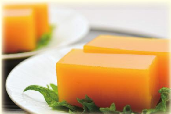
(料理協力: 赤穂市いずみ会)