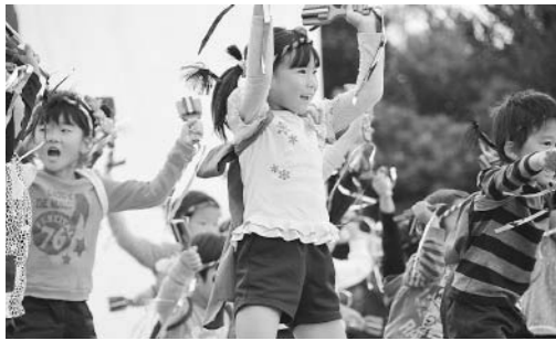
(第13回赤穂でえしよん祭りで踊る園児 H28.11)