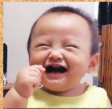
優しく可愛い男の子になってね😊