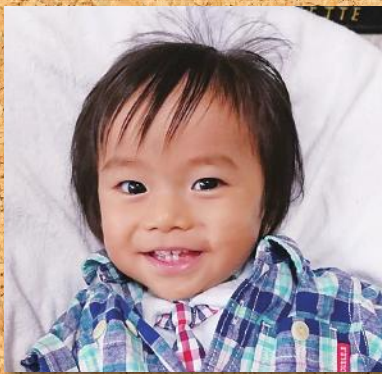
笑顔いっぱい大きくなあれ!!!