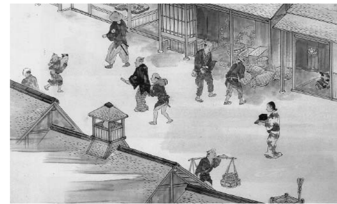
米屋五兵衛の店先 (米屋市立歴史博物館蔵「赤穂義士真観」のうち「吉良邸の偵察」)