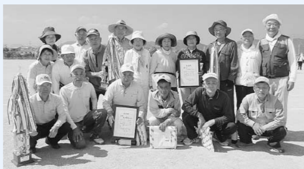
団体の部 入賞者の皆さん

団体の部で優勝した尾崎Aチームは、10月4日に淡路市で開催される兵庫県老人クラブ連合会「第5回グラウンドゴルフ県大会」に、市の代表として参加します。優勝を目指して頑張っていたきたいと思います。