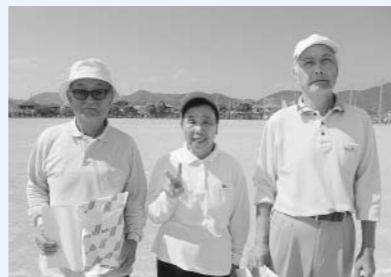
個人の部 入賞者の皆さん