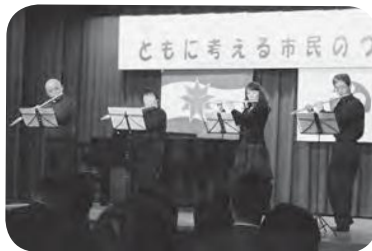
オープニングを飾った羽音色の演奏