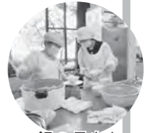
ご飯の量もしつかり計量します